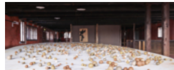
Biennale de Venise 2017 Palais Fortuny

« Les fontaines à boules » « art public, Ivry » « sphère » « Bibliothèque idéale » « installation de boules en terre »